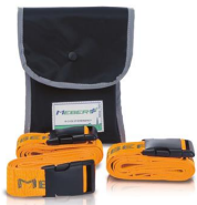
584 Sobre negro con 3 cinturones de color naranja de 2 piezas y hebilla de plástico de liberación rápida para camilla Ergon