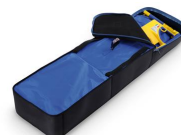
16150-001 Bolsa reforzado para el transporte