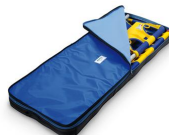
16150-002 Bolsa de almacenamiento Ergon