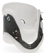
Patriot Baby 837 Verstellbare kinder-halskrause