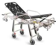
7265 Proof Barella autocaricante "Frog Lite Advance" in alluminio con maniglie estraibili e Trendelenburg