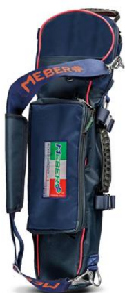
12072/BR "COVER OX 5 BR"- Portabombola professionale per bombole da lt 5