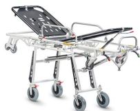
Frog Lite 7260 PROOF "FROG LITE" barella autocaricante in alluminio con trendelenburg certificata