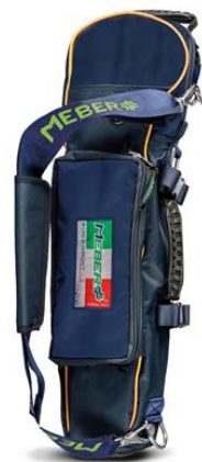
12072/BG "COVER OX 5 BG"- Portabombola professionale per bombole da lt 5