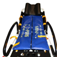
12154 Sistema di contenimento Bear Pods per obesi per barelle autocaricanti