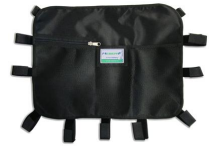
12025 Tasca portaoggetti multiuso nera per barelle autocaricanti