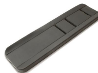
7013/N Materasso 3 pz. in Skay ignifugo elettrosaldato