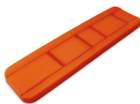
7014/A Materasso 4 pz. in Skay ignifugo elettrosaldato