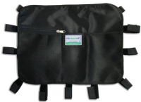
12025 Tasca portaoggetti multiuso nera per barelle autocaricanti