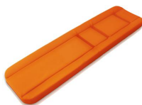
7013/A Materasso 3 pz. in Skay ignifugo elettrosaldato