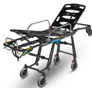
Mercury EL 7094 PROOF Barella autocaricante certificata versione alta