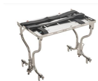
939 Piano portastrumenti per barelle