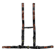
612/N-2/MEB Cintura toracica regolabile nera con aggancio a 4 punti e nastro MeBer per barelle autocaricanti e sedie