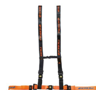
612/AN-2/MEB Cintura toracica regolabile arancio/nera con aggancio a 4 punti e nastro MeBer per barelle autocaricanti e sedie