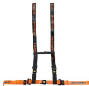
612/AN-2/MEB Cintura toracica regolabile arancio/nera con aggancio a 4 punti e nastro MeBer per barelle autocaricanti e sedie