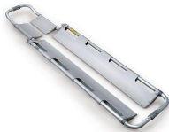
Maxima 631 Brancard cuillère atraumatique anodisé gris avec tronc/tête à 1 pc.