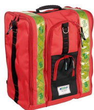
1366 Zaino rosso "115" con tasche laterali e scomparti FORNITO COMPLETO - CAPITOLATO TPSS