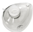
2403 Maschera per rianimazione in silicone mis. 3