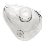
2404 Maschera per rianimazione in silicone mis. 4