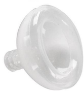
2402 Maschera per rianimazione in silicone mis. 2