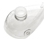
2405 Maschera per rianimazione in silicone mis. 5