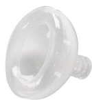
2401 Maschera per rianimazione in silicone mis. 1