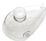
2405 Maschera per rianimazione in silicone mis. 5