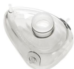
2404 Maschera per rianimazione in silicone mis. 4