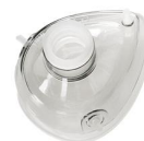
2403 Maschera per rianimazione in silicone mis. 3