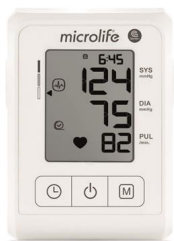
B1 CLASSIC 8534 Tensiomètre automatique avec brassard adulte