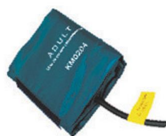
8548-004 Bracciale adulto per monitor multiparametrico PC-300