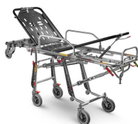
Mercury Cinque 7075/4RG PROOF Brancard à chargement automatique en acier inoxydable à 5 positions certifié EN1865 avec 4 roues pivotantes