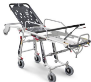
Mercury Lite Cinque 7095/4RG Proof Mercury Lite Cinque ; brancard en aluminium à chargement automatique à 5 positions avec 4 roues pivotantes certifié EN 1865, et avec matelas et ceintures