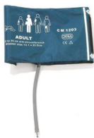
8540-002 Bracciale per adulti 27-35 cm