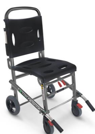
678 Extra Lite Basic Sedia portantina pieghevole