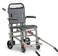
Extra 670/BR Sedia portantina scendiscale assistita con braccioli