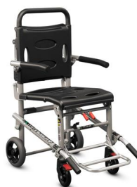
Extra Lite Standard 676 Sedia portantina 4 ruote pieghevole con pedana e braccioli