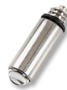
1681 Ampoule halogène 2,5v pour poignée de laryngoscope à fibre optique