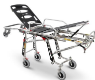
Mercury 7070/4RG PROOF Höhenverstellbare roll-in-trage aus edelstahl mit 4 drehbaren rädern zertifiziert