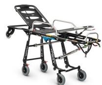
Mercury 7094 PROOF Roll-in-trage zertifiziert