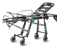
Mercury 7092 PROOF Roll-in-trage zertifiziert