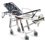
Mercury Lite 7080/4RG Proof Barella autocaricante in alluminio ad altezza variabile certificata con 4 ruote girevoli