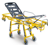
Frog 7210 PROOF "FROG" barella autocaricante gialla con trendelenburg certificata