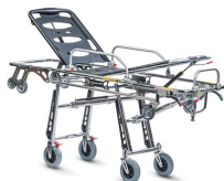
Frog 7240 PROOF "FROG PLUS" barella autocaricante con trendelenburg certificata