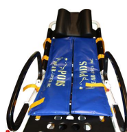
12154 Sistema di contenimento Bear Pods per obesi per barelle autocaricanti