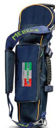
12072/BG "COVER OX 5 BG"- Portabombola professionale per bombole da lt 5