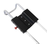
12128 Sistema allungabile per poggiatesta barella MeberX e Mercury