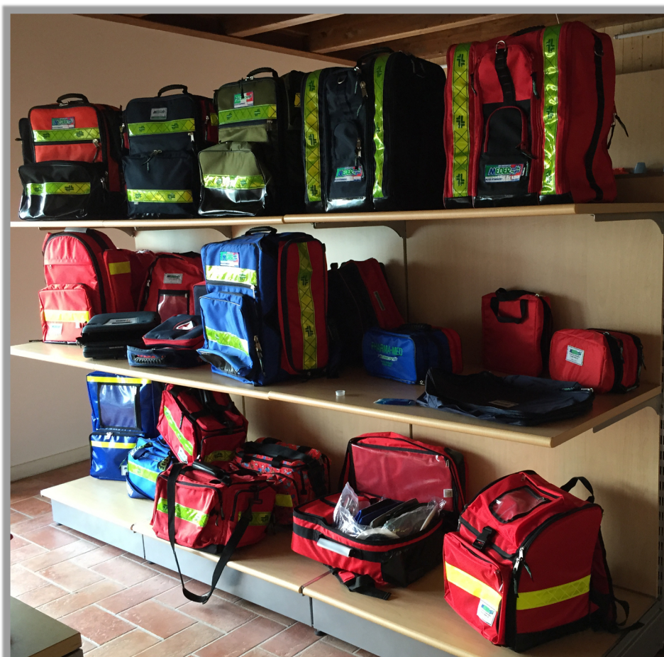
Immagine a lato: Showroom MeBer, esposizione della linea di zaini e borse MeBer

Siamo rimasti molto soddisfatti dal RESCUE ADVANCE. È uno zaino altamente versatile e, cosa molto importante, è molto intuitivo sia da controllare durante la compilazione della CHECK LIST a inizio turno, sia da utilizzare mentre si sta eseguendo un intervento di soccorso.