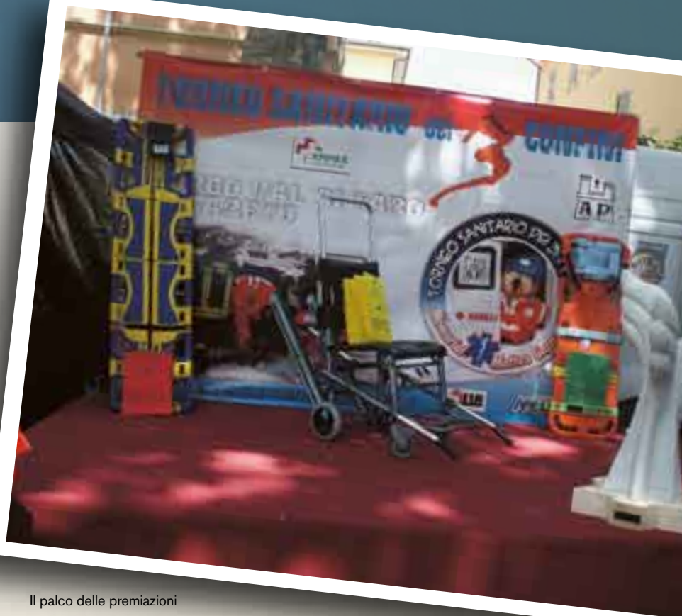
Il palco delle premiazioni