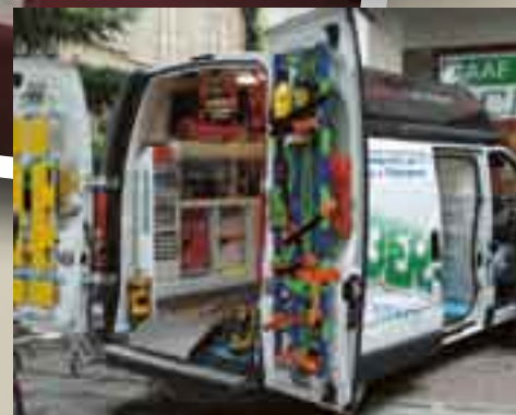
Veicolo dimostrativo Me.Ber. a disposizione dei partecipanti