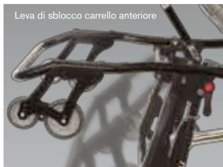
Leva di sblocco carrello anteriore

La certificazione rilasciata dall'ente certificatore notificato, assicura la conformità ai requisiti di sicurezza richiesti dalle vigenti norme europee (UNI EN 1789:2007 - UNI EN 1865:2001).