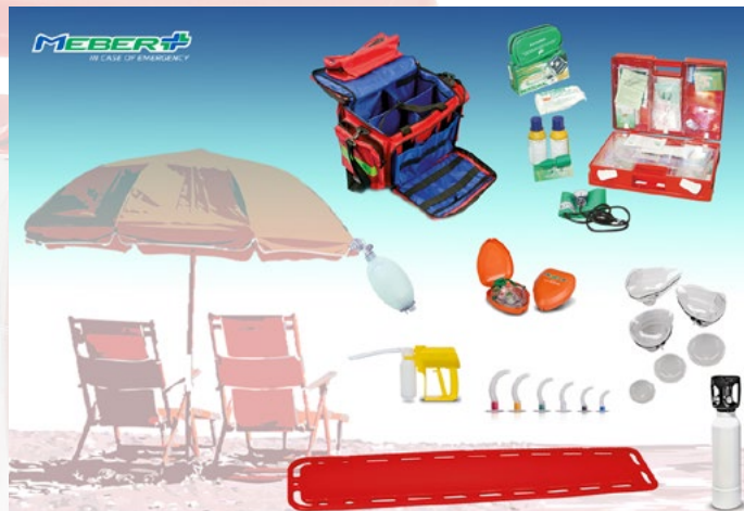
I prodotti MeBer per adempiere agli obblighi di legge

Vediamo, nello specifico, cosa richiede la capitaneria di porto. Fatte salve le eventuali disposizioni dell'Autorità regionale competente in materia di utilizzo del demanio marittimo, ogni struttura balneare deve, prima di tutto, essere provvista di un locale idoneo a prestare i primi soccorsi. All'interno del locale dovrà essere disponibile, e pronta all'uso, una dotazione di primo soccorso composta da: