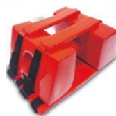
FERMACAPO ART. 629

Sul sito MeBer è disponibile un'ampia gamma di barelle per ogni tipo di soccorso. Link .