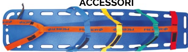
CINTURE RAGNO ART. 690