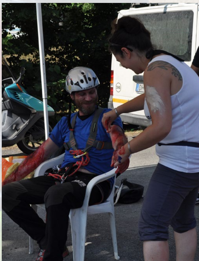
Particolare realismo ottenuto grazie a truccatori esperti