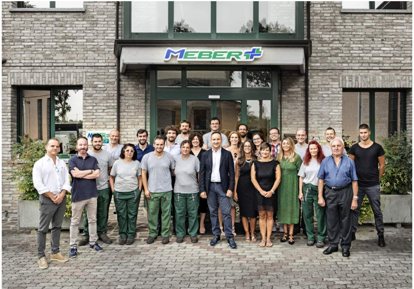
MeBer Settembre 2017