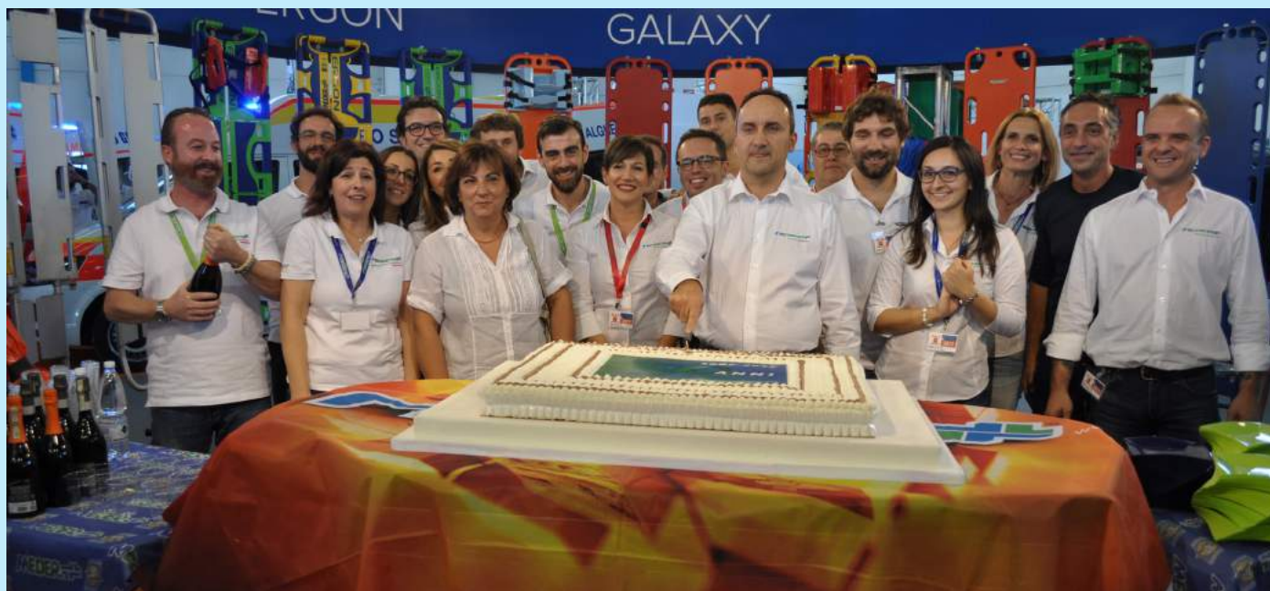
FESTEGGIAMENTI PER IL TRENTENNALE DELLA MEBER - SABATO 7 OTTOBRE 2017

Grande successo anche per i festeggiamenti del trentesimo anniversario dell'azienda che si sono svolti Sabato 7 Ottobre presso lo stand MeBer. L'iniziativa ha raccolto numerosi partecipanti che si sono riuniti per l'occasione. Per chi si fosse perso l'evento, sulla pagina Facebook sono state pubblicate tutte le foto della fiera di quest'anno (@meber.parma).