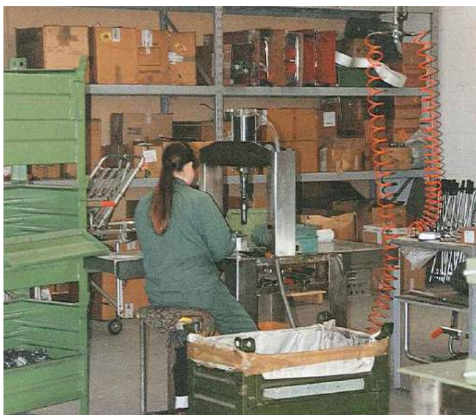
Foto magazzini MeBer 1995

essenziali per diventare un partner indispensabile per tutti gli operatori del settore!