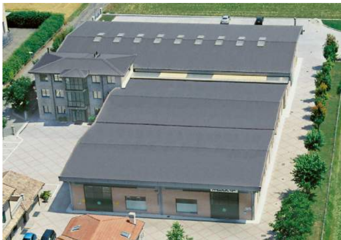
Panoramica dall'alto dell'azienda MeBer

Sono trascorsi trent'anni dalla fondazione e oggi MeBer è una tra le aziende leader a livello internazionale nel campo della progettazione e costruzione di attrezzature per l'emergenza medica, il recupero e il primo soccorso.