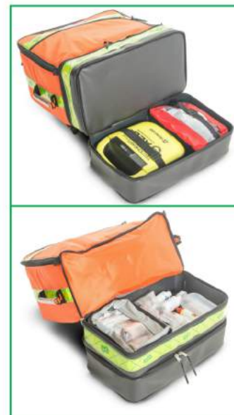
Immagini puramente indicative.

permette un facile stivaggio ed una immediata identificazione di tutti quegli strumenti utili alla medicazione e alla rianimazione. All'interno sono presenti quattro comode custodie asportabili di diverso colore per una facile identificazione del materiale in esse contenuto, oltre a un rotolo medicale multiuso, anch'esso asportabile, nel quale possono essere collocati diversi strumenti per averli subito a portata di mano. La base rigida dello zaino, grazie ai suoi due compartimenti separati, è stata studiata per collocare contenitori di liquidi per la pulizia e disinfezione delle ferite, e dispositivi per la rianimazione cardiovascolare; ad esempio un defibrillatore (vedi immagini).