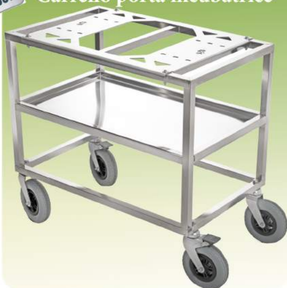
Art. 7034 Carrello porta incubatrice