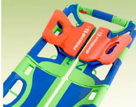
Art. 621 Fermacapo X-DOUBLE