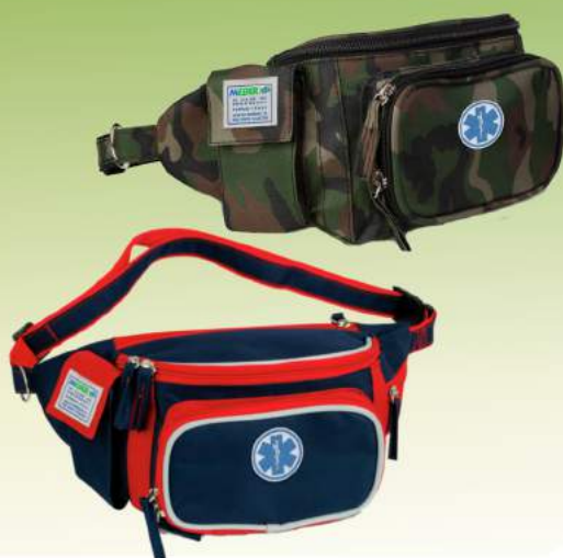
Art. 11340-11342 Marsupi multitasche